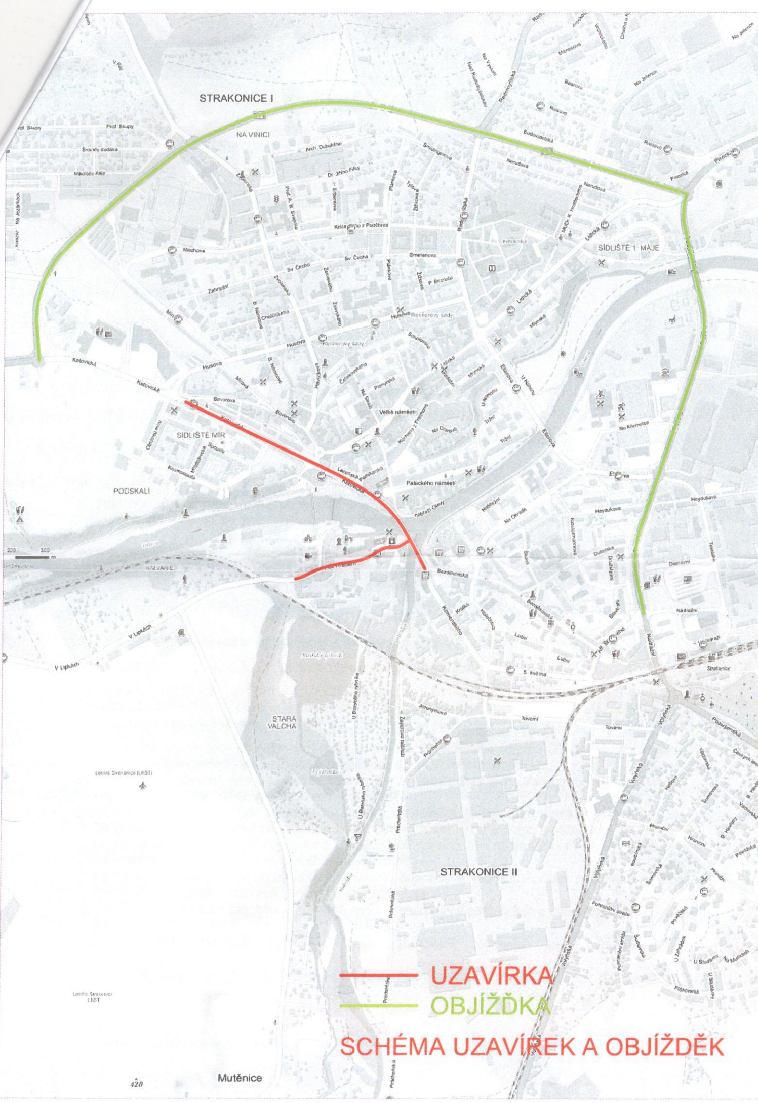
SCHÉMA UZAVÍREK A OBJÍŽDĚK