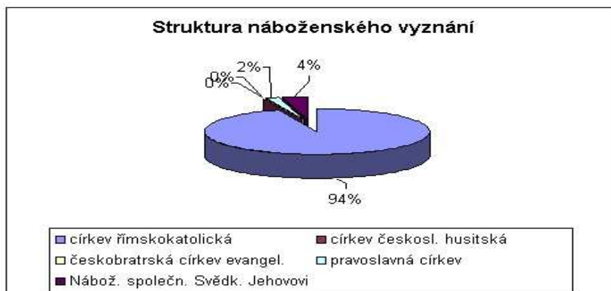
Graf č. 3

Z hlediska náboženského vyznání je nejoblíbenější jednoznačně římskokatolická církev, nejmenší zastoupení má církev českosl. husitská a českobratrská církev evangel.. Bez náboženského vyznání je 94 obyvatel.